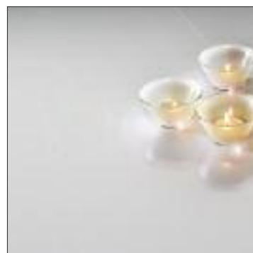
Ice · HH14854COL