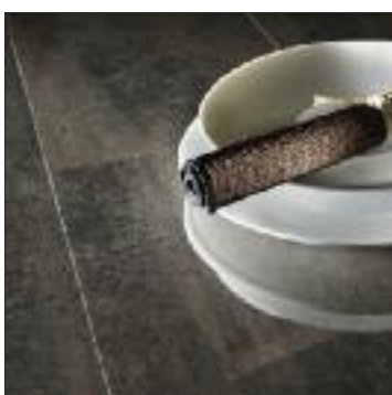
Ferrum · HH14754COL