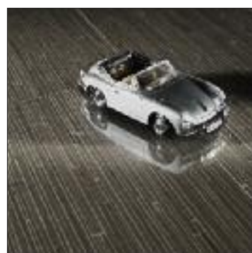
Reed · HH14654COL