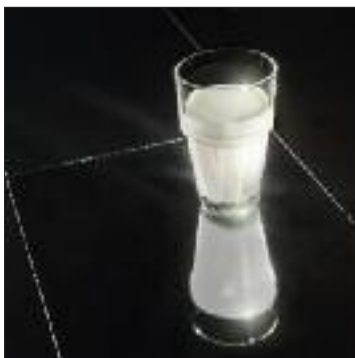
Deep Night · HH15054COL